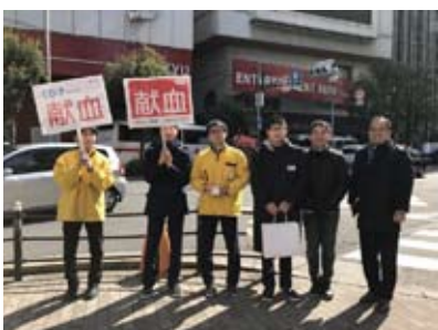
インターアクターも呼びかけ (清風高等学校 IAC、高槻中学校・高等学校 IAC)