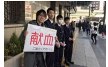
献血呼びかけ中の様子