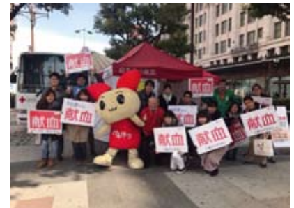
今回はけんけつちゃんも呼びかけに参加し、大成功の第二回地区献血となりました