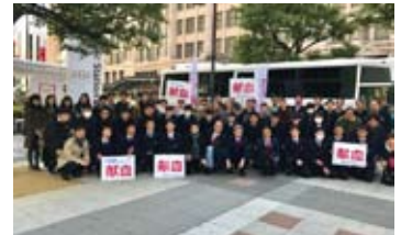
難波での集合写真