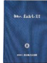
B5判 記念館35周年記念誌 本文268ページ/2,500円