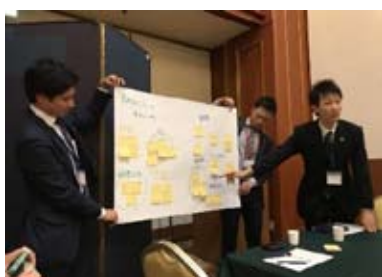
情報交換会での発表

新人アクターからベテランアクターまで、意見交換を行いながらしっかりと交流の深められるとても有意義な時間となりました。