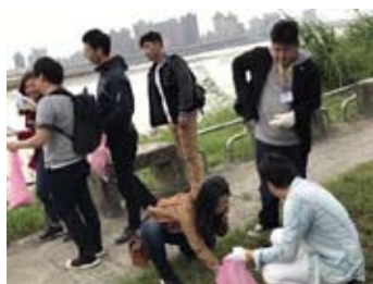
台湾の公園をクリーンハイク