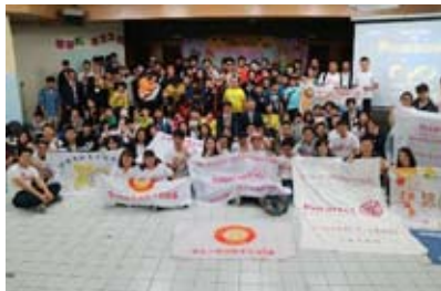
日本文化を伝えるに小学校へ