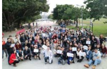
台湾市内巡り後の集合写真