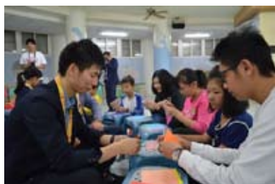
折り紙をレクチャー