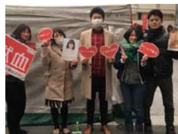
SNS グッズで若者へ PR