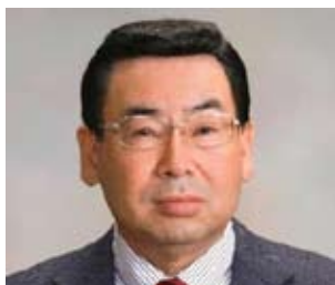
来たれ学友中心の若者の集い 坂出東四国ロータリー衛星クラブ 入会金1万円・年会費7万円 衛星クラブ議長

一方、各クラブと地区にとって重要なことは、ロータリアンがそれぞれの「地域社会」で世の為、人の為に日々活動していることを地元の人々に先ずよくご理解頂くことです。「世界を変える行動人」はその延長線上にあります。原点となる「地域社会を変える行動人」は皆様方のそれぞれのクラブや地区にいらっしゃいます。