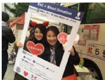
SNS パネルの使い PR