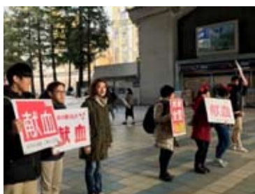
台湾アクターも呼びかけ活動

また、この数字は過去最高の採血者数となっております。これもひとえに皆様のご協力の賜物です。重ねて御礼申し上げます。