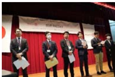
メインプログラム説明