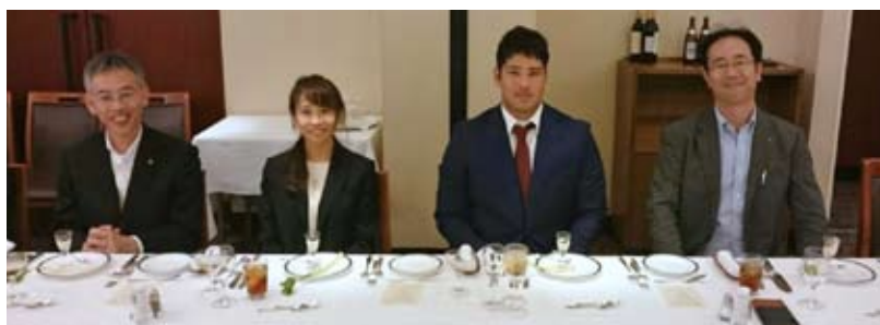
クラブカウンセラーと

幸い文献は非常に興味深いものばかりで、読みながら子供のようにワクワクします。今週のテスト、発表、他の課題提出のため一生懸命努めてまいります。