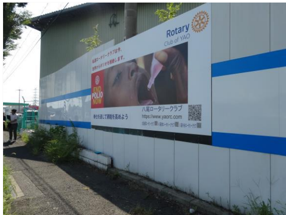
八尾ロータリークラブ | 国道175号線