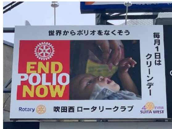
吹田西ロータリークラブ | 江坂公園