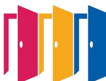
ロータリーは機会の扉を開く