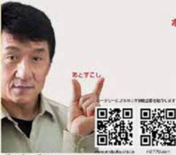
ポリオ根絶まで あとすこし

日本でも未だ多くの患者が苦しんでいる感染症ポリオ(小児まひ)。すでに発症数は全世界で99.8%減少しています。しかし、根絶まであと少し。ロータリークラブは長年に亘ってその根絶に力を注いでいます。10月24日は世界ポリオデー。私達ロータリー会員は各地でポリオ根絶に向けた活動を一直に行います。