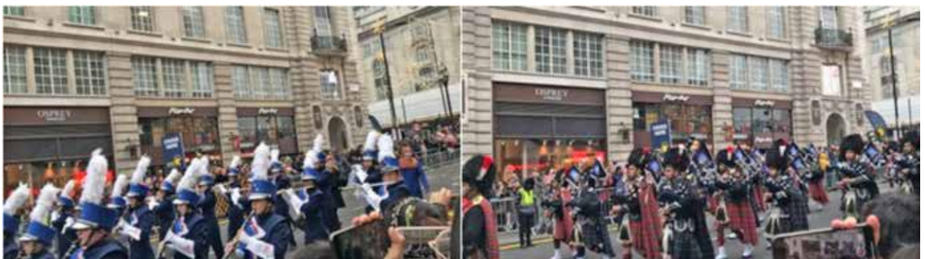
ニューイヤーパレードの様子。1/1ロンドンの街をパレードが3時間かけて練り歩きます。