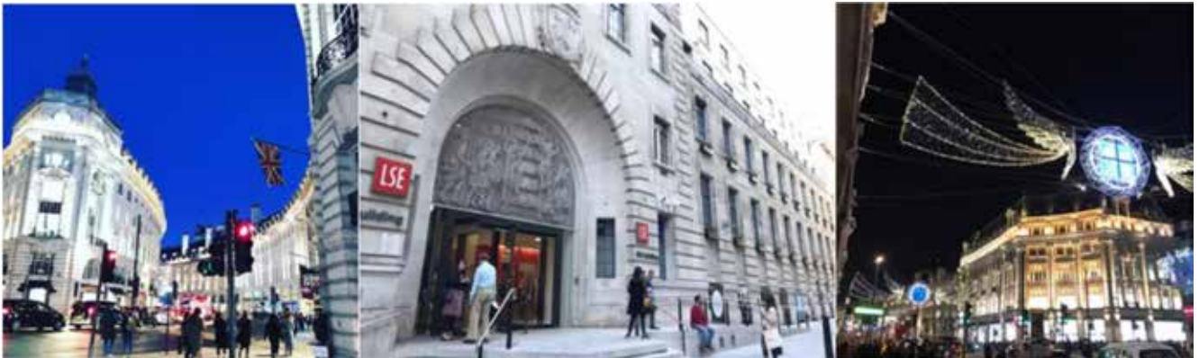
左) ロンドンの繁華街ピカデリーサーカスの様子です。街並みはやはり綺麗です。 中) LSEの正面玄関的建物です。実はLSEのキャンパス自体は割と狭く街中に溶け込んでいます。 右) クリスマスの時期は街中がこのようにイルミネーションで飾られます。

改めて、この度グローバル奨学生でのロンドン留学という貴重な機会を賜り、ありがとうございます。引き続き、勉学と現地でのロータリー活動に勤しんで参ります。