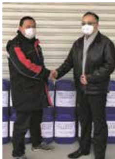
学友会名を記載した支援物資

新型コロナウイルスの感染拡大を受け、上海米山学友会では会員から寄せられた義援金をもとに、相次いで支援活動を展開しています。まず1月25日には、N99型マスクを武漢協和病院へ寄贈。つづいて27