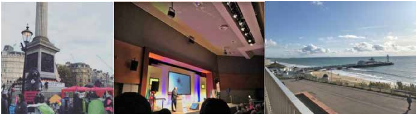
左) 寮の前の広場が環境問題のデモ隊に2週間占拠されました。この街では週末よくデモがあります。市民社会運動の根強さはさすがヨーロッパを感じさせます。 右) 10月にロータリーの会議でBournemouthという港町に行きました。ビーチがあるリゾート地だそうです。大会の規模がとて大きく圧倒されましたが、各国からの奨学生とも交流ができ有意義な会議となりました。