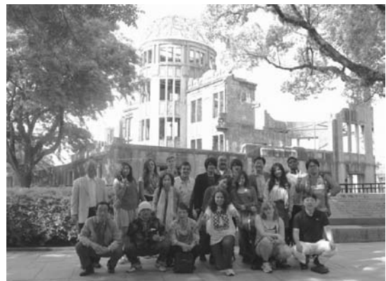
来日学生と派遣学生の広島研修旅行(2680地区と合同)