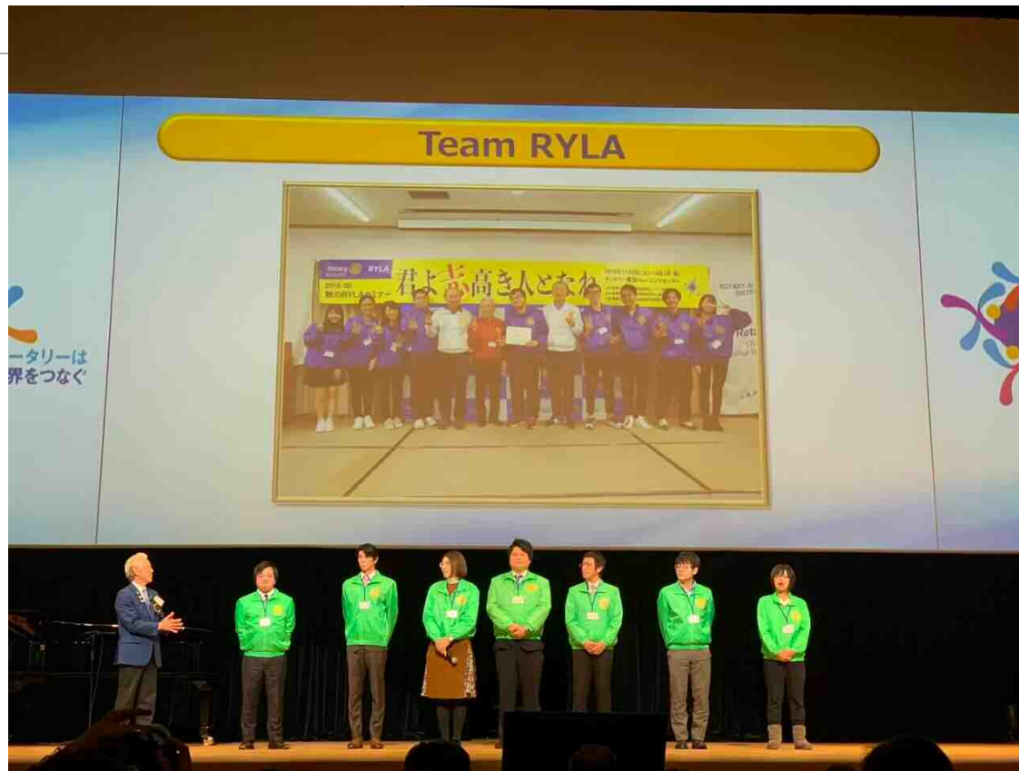
地区大会への参加