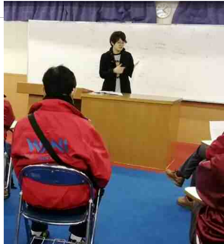
プレRYLAや研修交流会