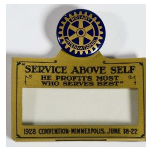
1928年ロータリー国際大会で参加者が着用したバッジ