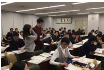
メインプログラム中の様子