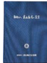
B5判 記念館35周年記念誌 本文268ページ/2,500円