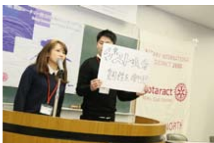
マニフェスト発表の様子

最後に今回この行事を準備して下さいました大阪御堂筋本町ローターアクトクラブの皆様、提唱ロータリークラブの大阪御堂筋本町ロータリークラブの皆様、そして様々なご指導頂きました地区ローターアクト委員会のご協力に感謝申し上げます、「地区連絡協議会」のご報告とさせていただきます。