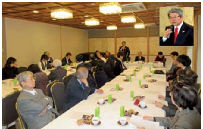
(本文執筆に当たり「小学校学習指導要領解説 総則編(抄) 平成27年7月 文部科学省」を参考にした)

ガバナーも冒頭の挨拶で言われた「子供にとって見本となるべき大人の社会に職業倫理や道徳に欠ける事象が散見される」という問題についても、職業奉仕、過重労働、ネット社会の問題も含めて、かなりの時間をかけて話し合った。詳細は後日発表する本フォーラムの報告書をご覧いただければ幸いである。