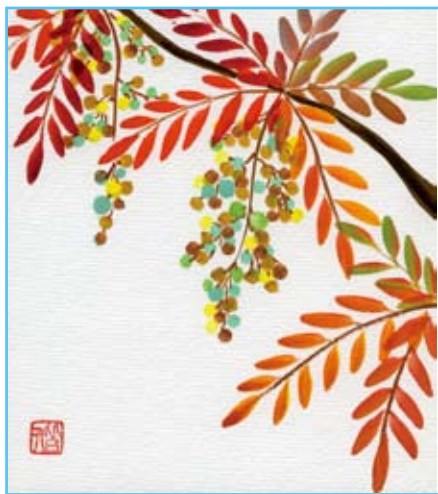
はげ 櫨の木 花言葉「真心」