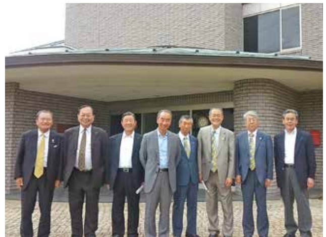
米山梅吉記念会館を訪問