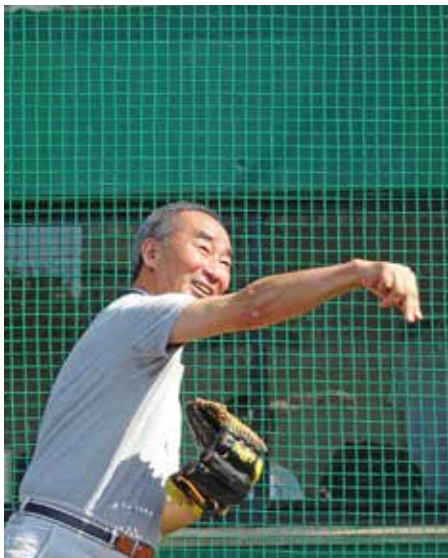
ガバナー杯始球式