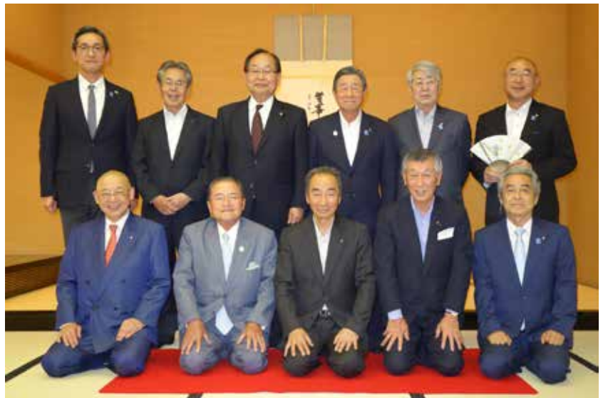
1年間ありがとうございました