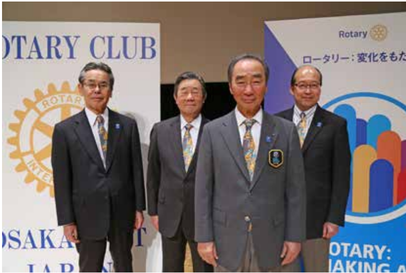
ガバナー年度の始まり